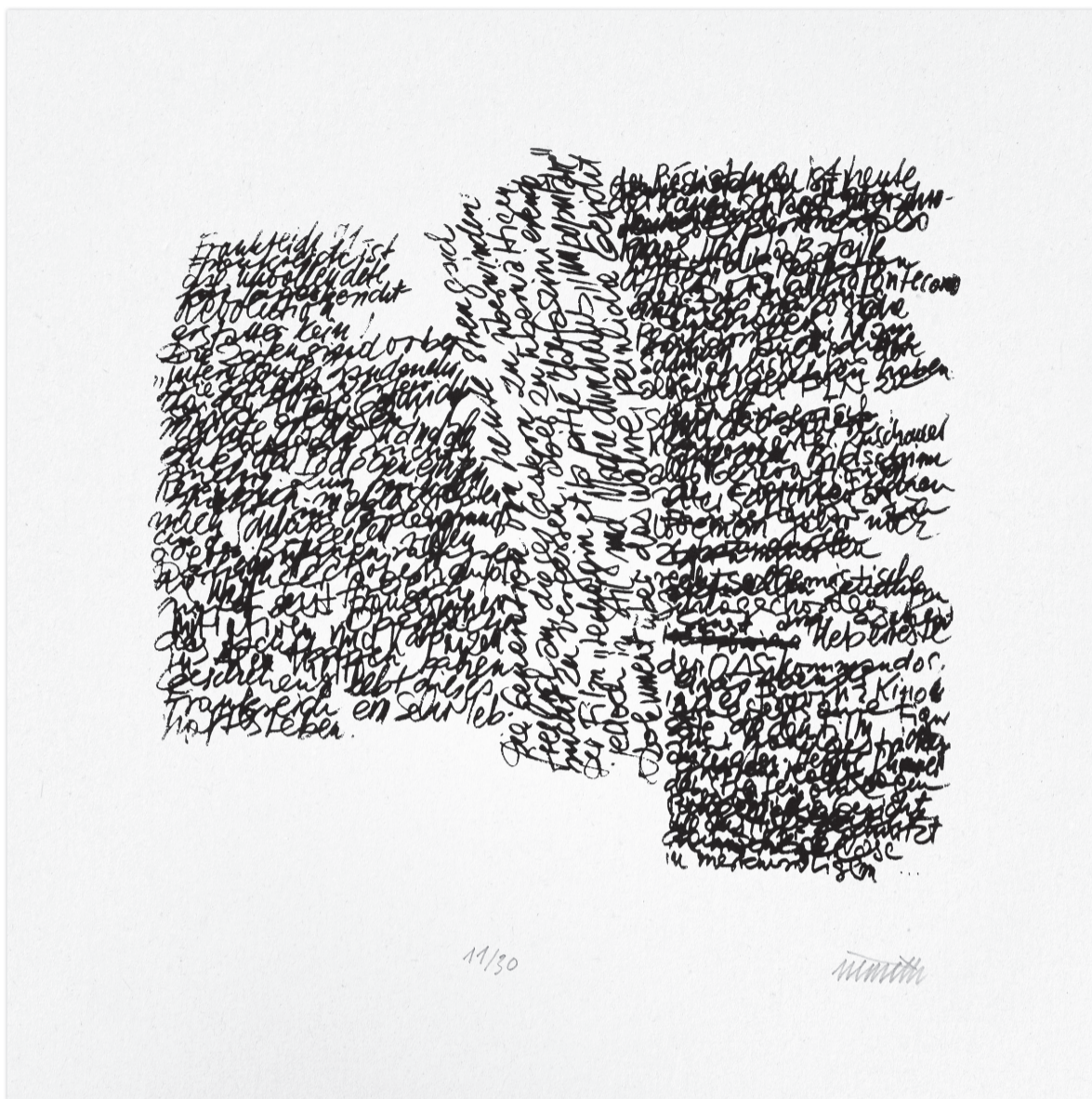
Ohne Titel, aus der Kunstmappe, Siebdruck, 330 x 330 mm, 2009