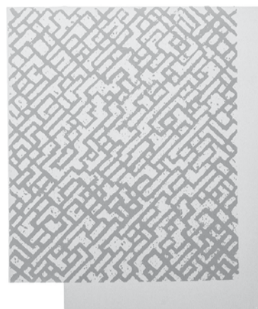
Siebdruck, aus der Kunstmappe, 330 x 330 mm, 2009

Das neue Etikett von «Vitis Antiqua 1798» zeigt ein Detail eines Gemäldes von Janos Nemeth aus dem Jahr 2009. Die Farbfeldmalerei in orange-rot auf hellblauem Grund erzeugt eine schöne Dreidimensionalität, das Zusammenspiel der Komplementärfarben in diagonaler Ausrichtung wirkt auf die Sinne anregend und zeitlos modern.