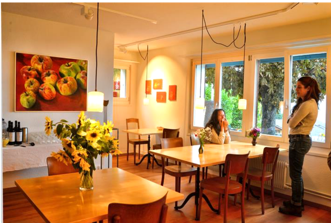
Ausstellungsraum im Café Paradiesli